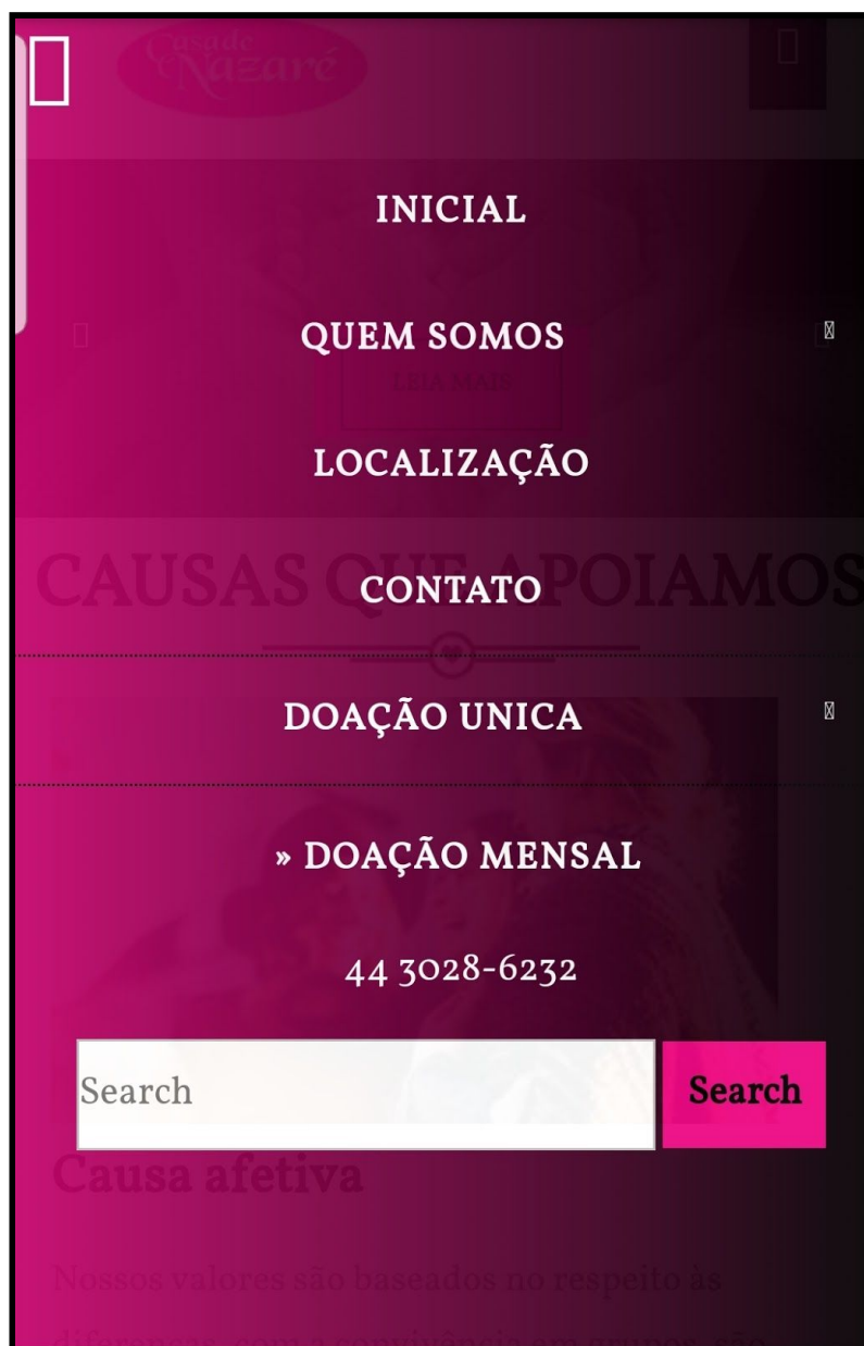
Imagem capturada da tela de um celular Samsung Galaxy S7.